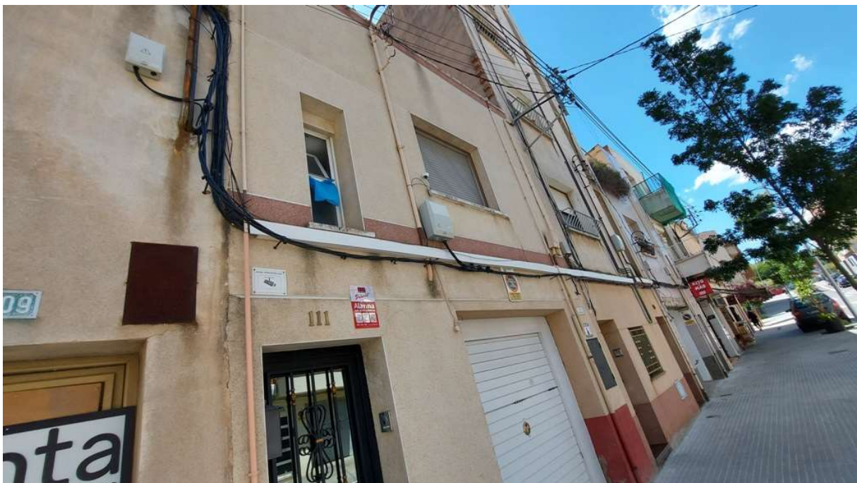
F4. Actuació 109: els cables elèctrics estan embridats amb els cables de telecomunicacions