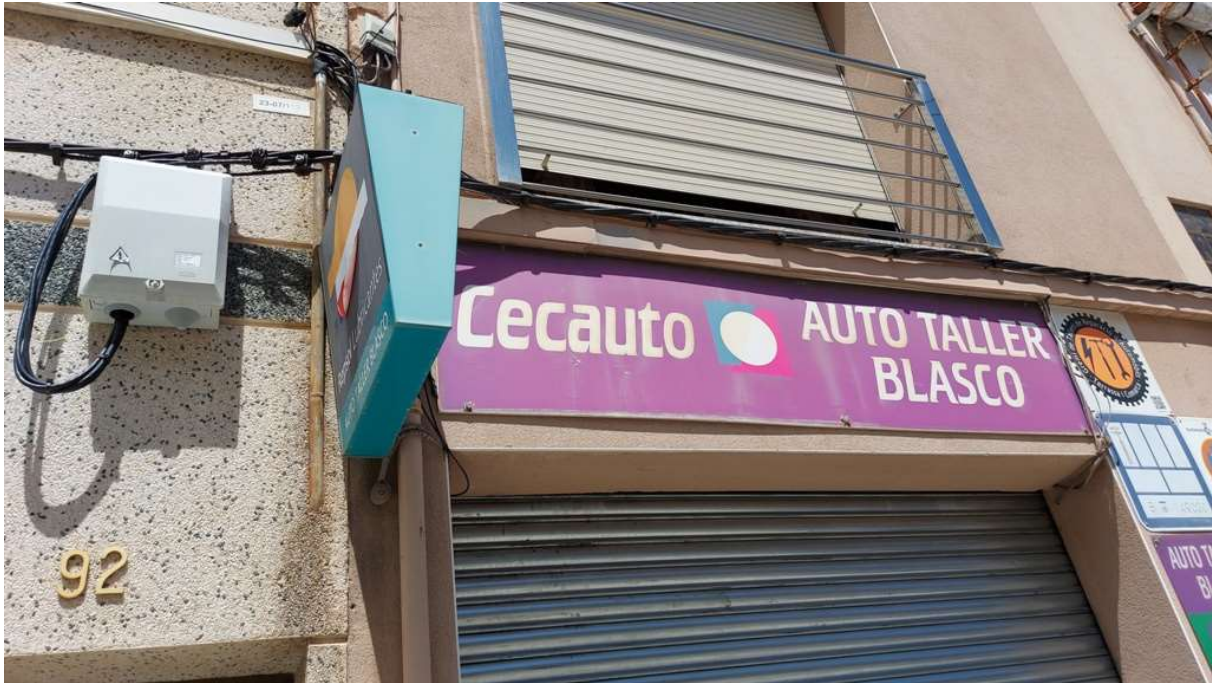
F1. Actuació al número 90: cable sense protegir i no guarda la distància amb el balcó