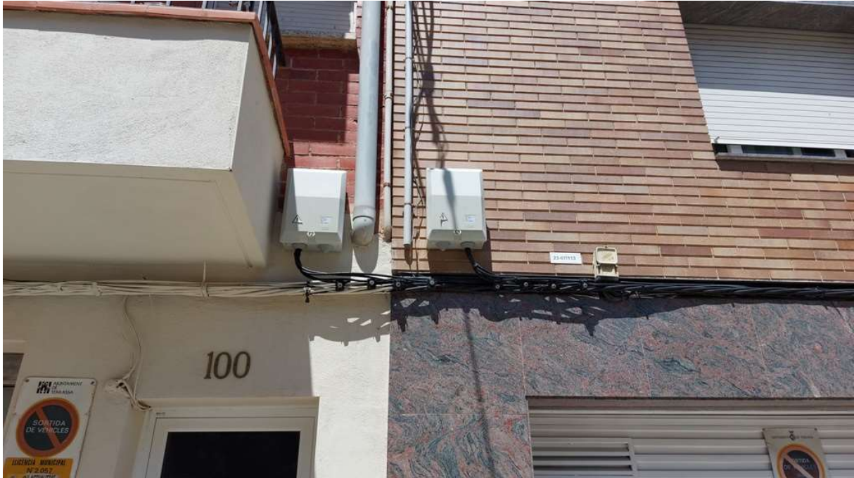
F3. Actuacions als números 98 i 100: els cables elèctrics estan embridats amb els cables de telecomunicacions