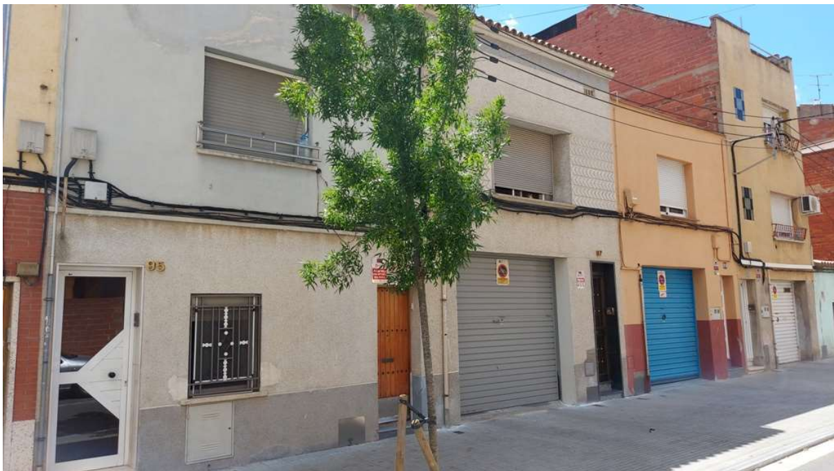
F2. Actuacions als números 97 i 99: els cables no guarden les distàncies amb les finestres existents