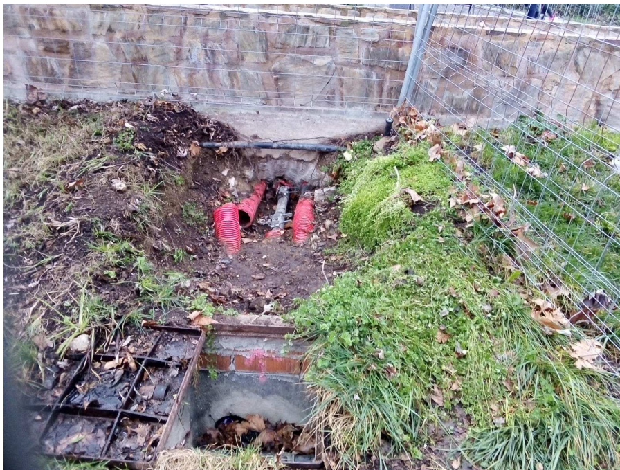
Foto 2. Tub de reg sota el canal on hi ha la fuga d'aigua.