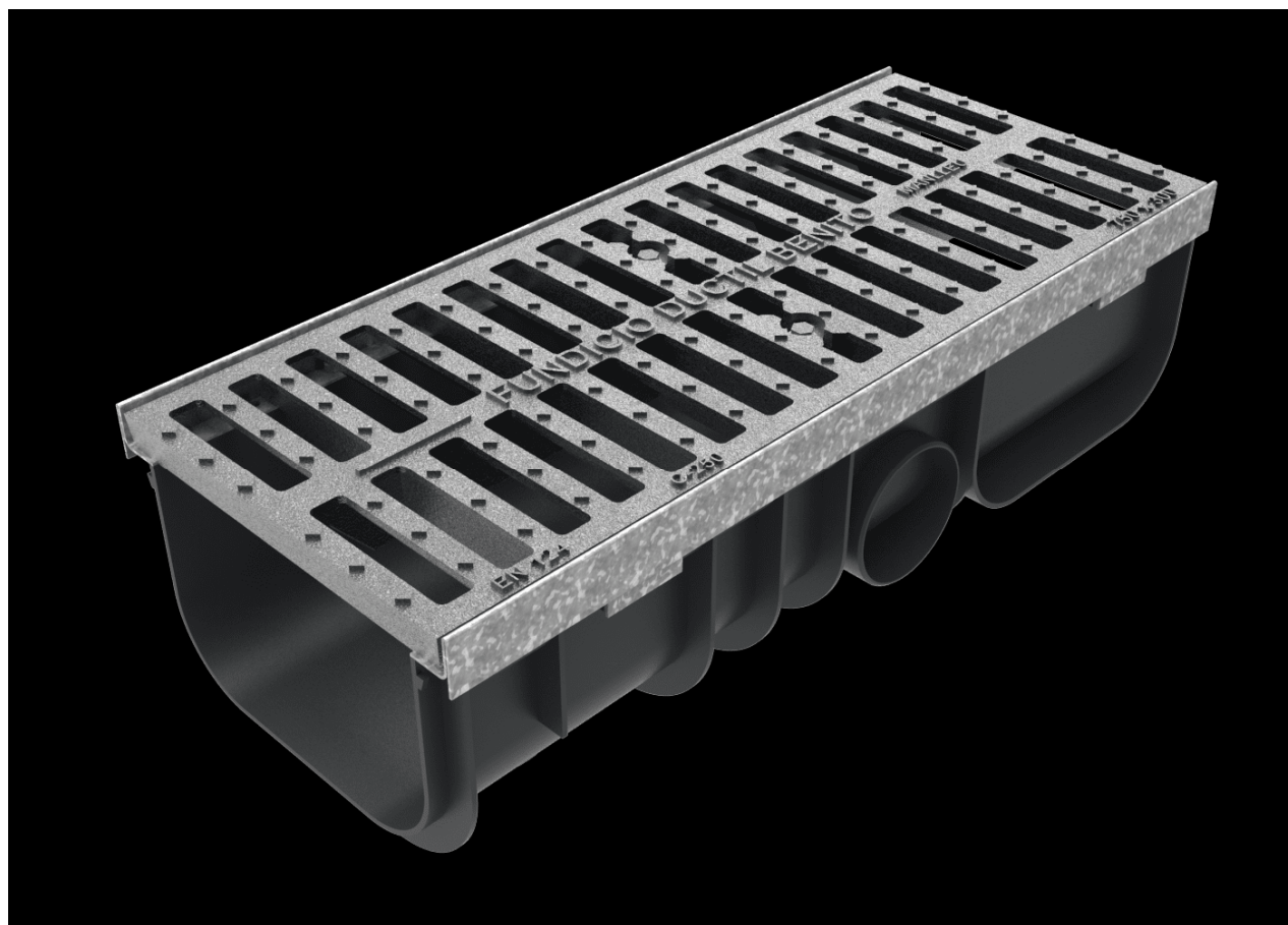
Exemple de reixa recol·lectora